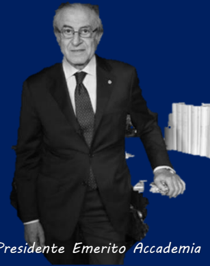
Presidente Emerito Accademia