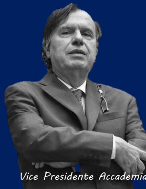
Vice Presidente Accademia