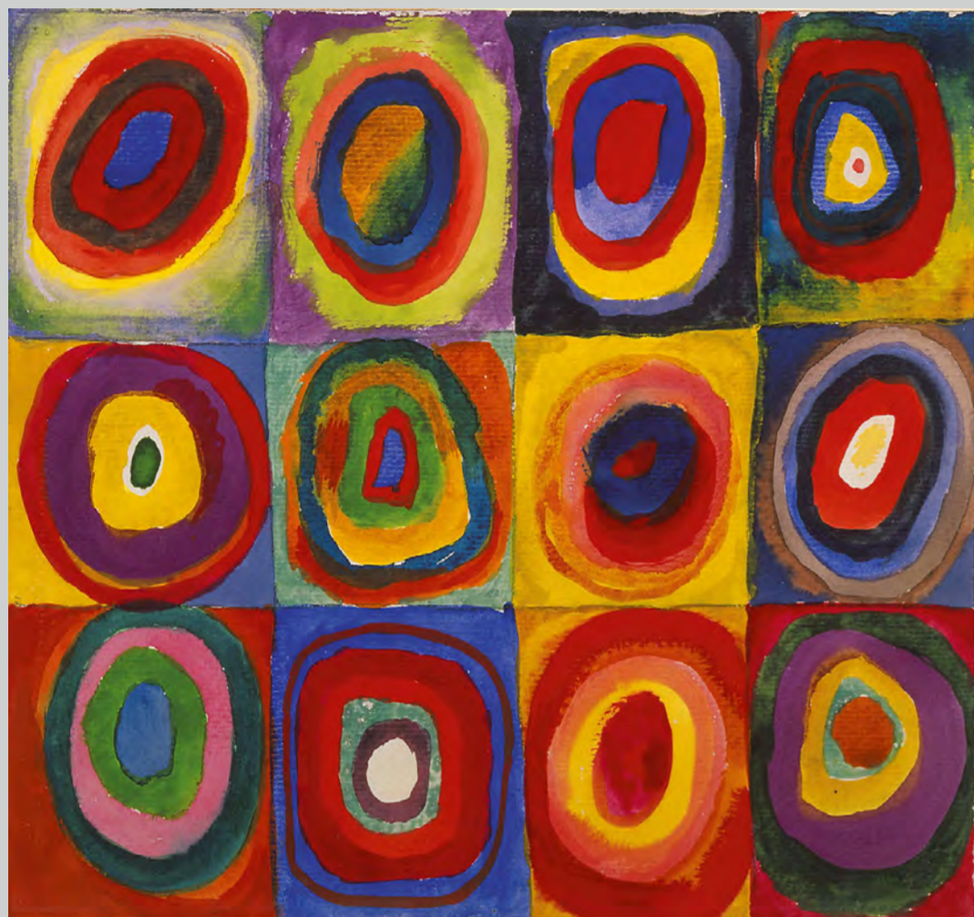
Farbstudie Quadrate, Wassily Kandinsky, 1913 – A distinct and unique transcriptional program, expressed by tumor-associated macrophage (Biswas et al, Blood 2006).

“Immunità e vaccini, dal cancro al COVID-19”